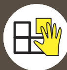
COLOCACIÓN Y REJUNTADO